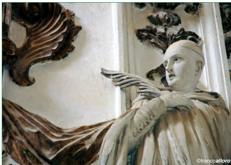
Chiesa di Santa Caterina - Particolare