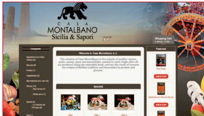
Casa Montalbano una realtà di e-commerce a Sambuca