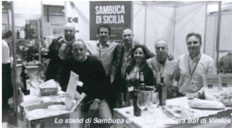
Lo stand di Sambuca di Sicilia alla fiera Baf di Vilnius

Le eccellenze enogastronomiche di Sambuca di Sicilia in mostra alla fiera internazionale Baf di Vilnius (Lituania) da venerdì 20 a domenica 22 Novembre.