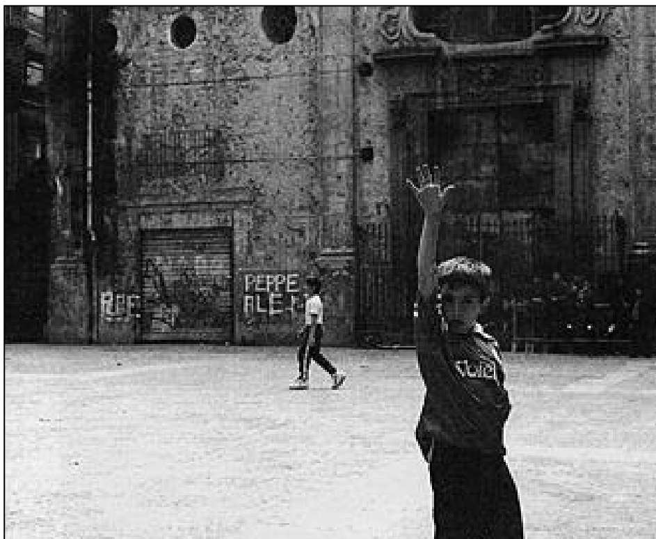
Spaccato di vita napoletana "I vicoli"

Le fotografie scattate da Maria Izzo nei suoi viaggi intorno al mondo sono immagini che ci dimostrano l'attenzione della Signora Napoletana verso luoghi da raccontare, soprattutto visivamente, esse sottolineano innanzitutto, della loro