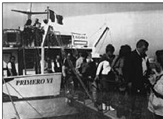
L'arrivo a Forio