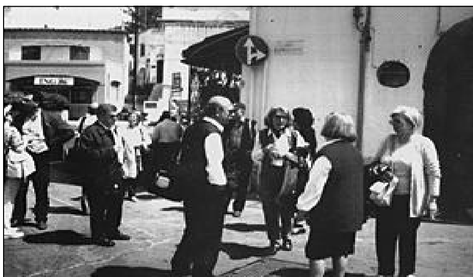
Soci in attesa dei pullmann a Forio