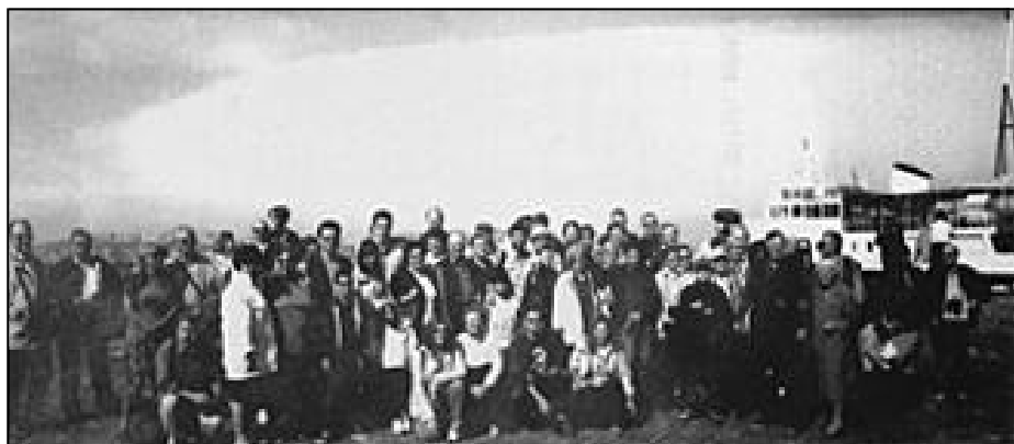
Foto di gruppo a Procida

Il XII° congresso quest'anno ci ha visti riuniti sulla splendida isola di Ischia e, così come è stato nel '99 a Palermo, la partecipazione è stata talmente massiccia da creare qualche problema organizzativo, ma si sa le isole esercitano un tale fascino che i fotoamatori vengono di buon grado accompagnati dai familiari, lasciandosi a loro volta coinvolgere dalla voglia di fotografare. È ciò che è successo ad Ischia, infatti un buon numero di signore che hanno avuto più tempo di noi per visitare l'isola, ha deciso di confrontarsi e di rivedere il materiale fotografico realizzato per ottenere, se è possibile, una piccola mostra. Ma l'entusiasmo comincia già sul traghetto che da Pozzuoli porta ad Ischia. Le bellezze naturali, la rigogliosa vegetazione già dà il benvenuto quando il traghetto sta ancora solcando l'argenteo mare. Iniziat i lavori congressuali, un