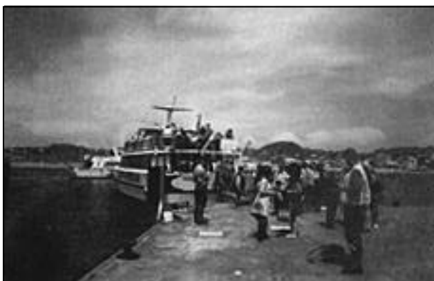
In partenza da Forio per Procida

Durante il giro dell'isola ci siamo soffermati per fotografare a S. Angelo, estrema