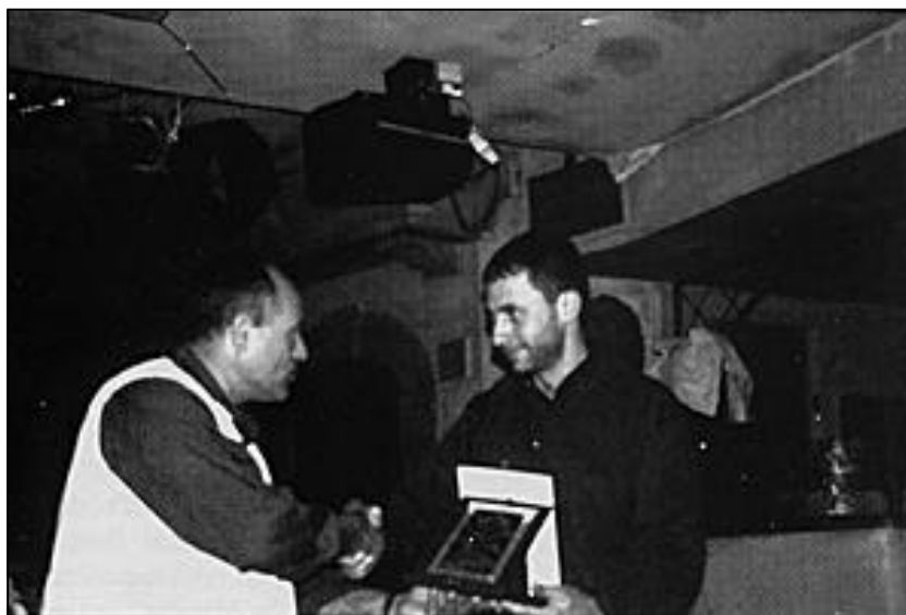
Emanuele Costanzo di "Fotografare" premiato dal Segretario G. Romeo