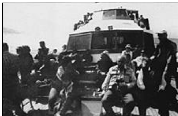
In navigazione verso Procida