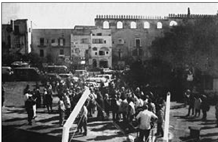
Arrivo al Porto di Procida