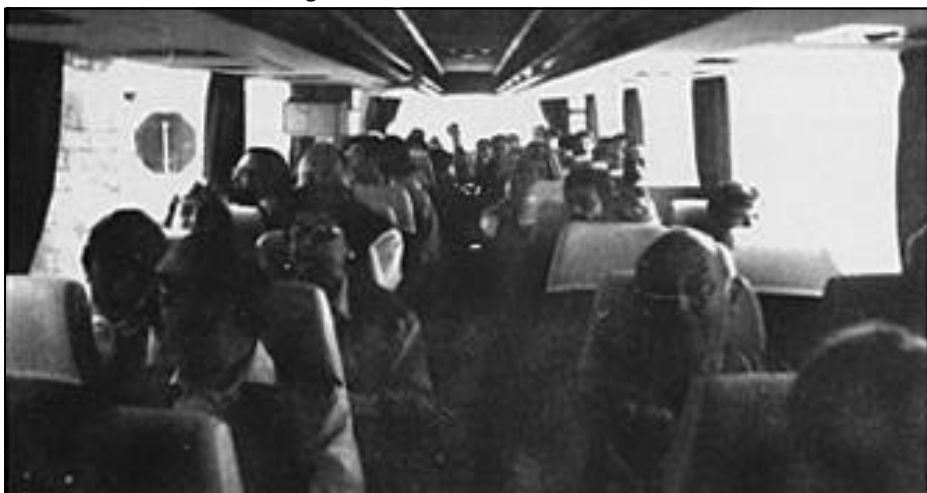
In pullman in giro per l'isola

forte momento di aggregazione è stato il giro di pullman dell'isola che ci ha dato la possibilità di ammirare le bellezze degli altri comuni di cui si compone Ischia: Lacco Ameno, Casamicciola, nota per le