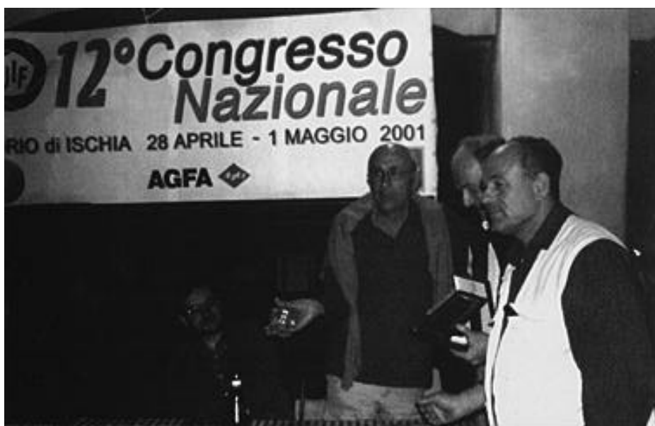
Il Maestro Franco Fontana mostra la tessera di socio onorario dell'U.I.F. - Foto di M. Savatter

Accanto a quella di Fontana i congressisti hanno avuto l'opportunità di ammirare un'altra mostra estremamente interessante: 25 foto originali del brasiliense Sebastiao Salgado dal titolo "In Cammino" esposte nella galleria "Telasi" di Ischia Porto. Salgado è il fotografo contemporaneo che racconta la dura realtà del lavoro e tecnicamente si distingue perché scatta quasi sempre in bianco e nero, esasperando la carica drammatica di ogni singola immagine contrastandola molto in fase di stampa.