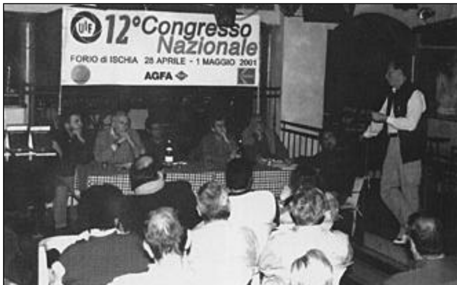
Un momento del Dibattito

Nella giornata conclusiva la mattinata è stata dedicata alla gita a Procida con giro