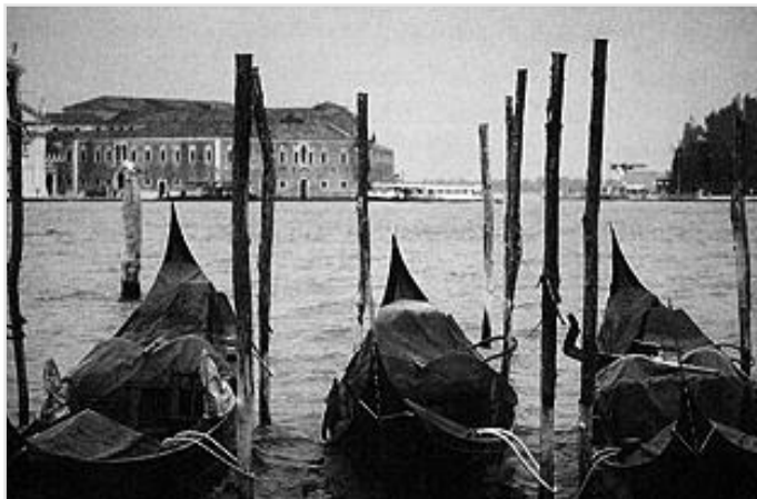
Il Gruppo UIF di Palermo

te nella stessa area del sito originario "presisma". All'arrivo rimaniamo subito colpiti dai resti della chiesa madre e ancora più dalla poco distante chiesa Madonna delle Grazie, recuperata tramite la costruzione di ampie vetrate che si raccordano alle pareti risparmiate dal movimento tellurico. Affascinante ed elegante il palazzo Gattopardo, che non a caso porta questo nome infatti oltre ad essere sede del municipio, dall'ottobre del duemila e sede anche del parco letterario "Giuseppe Tomasi di Lampedusa" che qui ebbe residenza. E quasi sera e siamo di ritorno sotto la pioggia, che ci ha risparmiato regalandoci una di quelle giornate di sole e nuvole, con differenti condizioni di luce e forse ancora più stimolante per i nostri scatti.