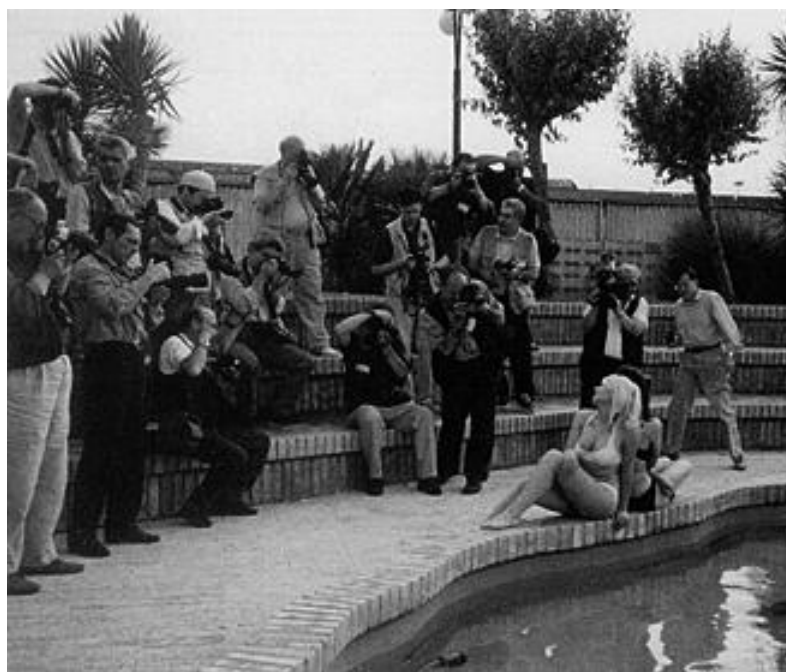
Soci UIF impegnati a fotografare le modelle

“FOTOGRAFARE”, “REFLEX”, oppure “TUTTIFOTOGRAFI”, nelle pagine apposite delle varie pubblicazioni, per trovare il libro guida che più farà per noi e per le nostre esigenze. E se utilizzerete le foto per esposizioni, concorsi, ecc. non dimenticate la