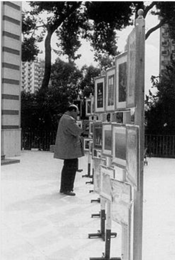
L'esposizione nello spiazzo antistante la Chiesa dei Salesiani "Don Bosco" di Palermo