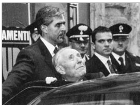
Il Presidente della Repubblica Carlo Azeglio Ciampi