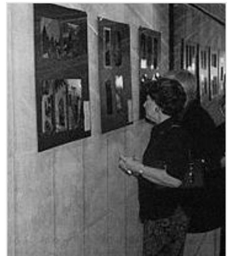
Un particolare della mostra+