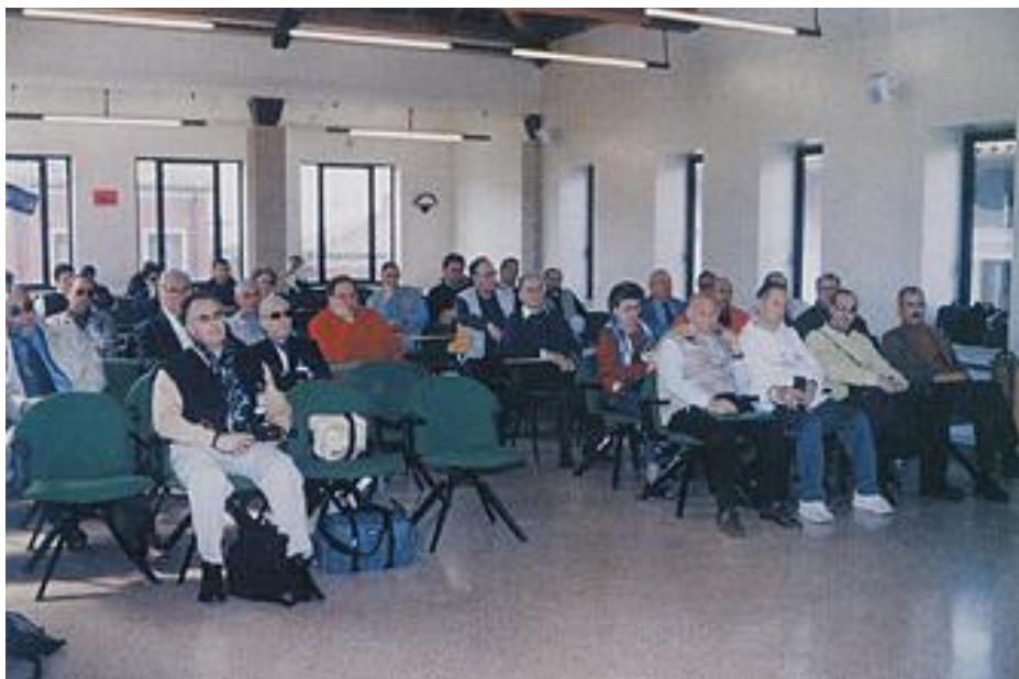
Un momento dell'assemblea dei soci