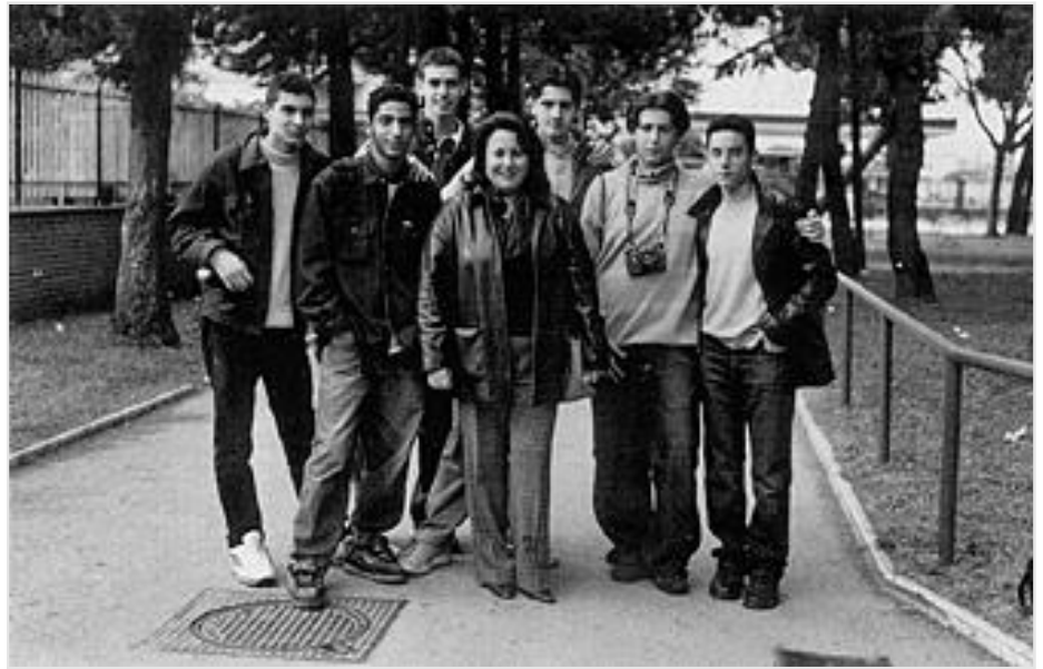
Gruppo di allievi dell'I.T.I.S. E. Barsanti di Pomigliano d'Arco con la loro insegnante

L'Amministrazione Comunale, nell'ambito del progetto "Le chiavi della città", ha voluto promuovere tali corsi per offrire ai giovani un percorso progettuale, che affiancasse e favorisse la piena realizzazione dell'offerta formativa, già predisposta dai singoli istituti. L'Unione Italiana Fotoamatori, attraverso il delegato di zona Luciano Masini, ha realizzato i suddetti corsi di primo livello per diffondere fra i giovani il piacere della fotografia e per far conoscere ed apprezzare il linguaggio delle immagini, capaci di trasmettere emozioni e sentimenti. I corsi di fotografia mirano non solo a fornire ai giovani tecniche operative, ma creano occasioni di arricchimento culturale, diventando momento di incontro e di aggregazione, di confronto e di scambio di opinioni, anche fra varie generazioni, offrendo altresì nuovi interessi ed un rafforzamento formativo ed occupazionale al loro futuro. Il Dirigente scolastico del Liceo "V.