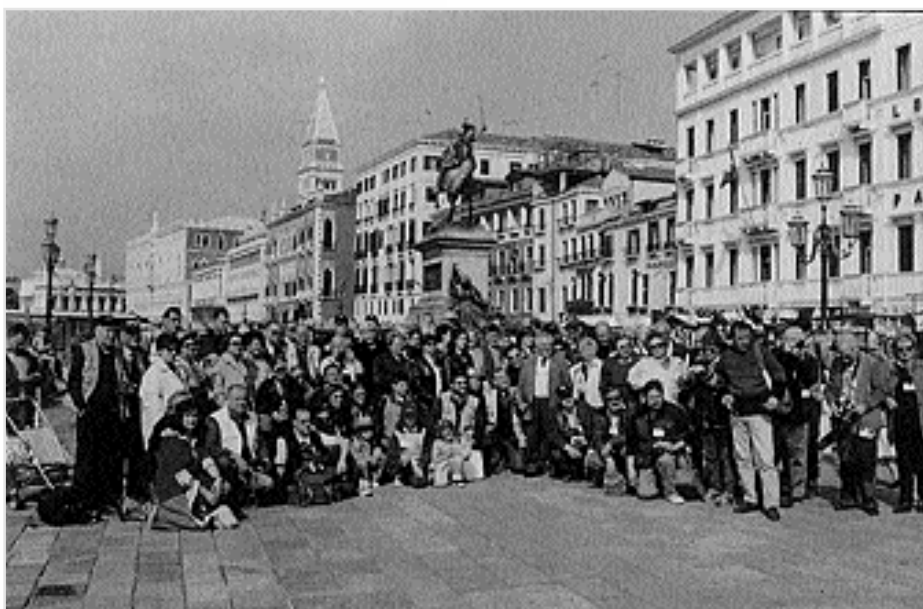
Foto di gruppo a Venezia

Per quanto riguarda la stampa delle foto a colori, rimane invariata la quota di contributo di € 50 per ogni foto.