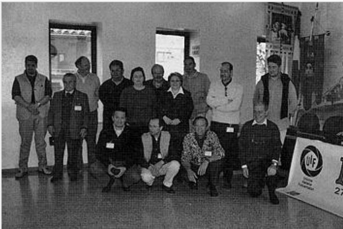
I nuovi soci UIF presenti a Caorle