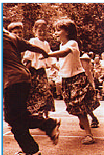
"Il cerchio giocoso" di Marco Ferrero