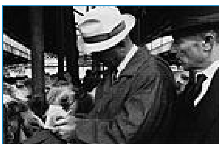
"Foro Boario" di Angelo Partenza