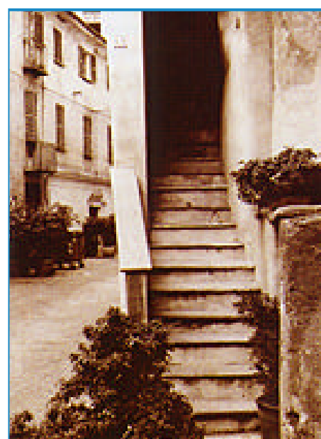
"Angoli senza tempo" di Luca Di Napoli