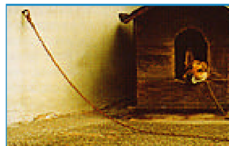
"Il conforto di una cuccia" di Alessandro Bondi