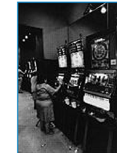
"L'utopia del benessere" di Giorgio Serazzi