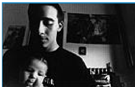
"Fratelli" di Matteo Bisaccia