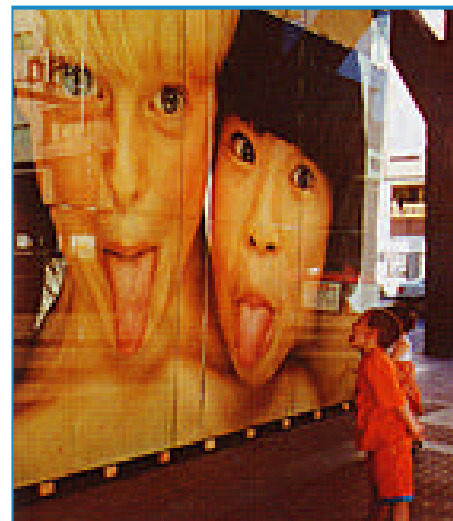
"Riflessi" di Angelo Partenza