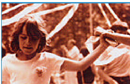
"La danza in un cerchio" di Marco Ferrero

Inoltre la Giuria ha deciso di assegnare il Premio Speciale all'autore Giorgio Serazzi perché è riuscito ad esprimere un particolare racconto con la presentazione della serie fotografica rappresentata dalle opere n°3008-3009-3010-3011 dal titolo: "Viadotto Soleri" - 1913/1937 Storica e tragica "Porta della Città".