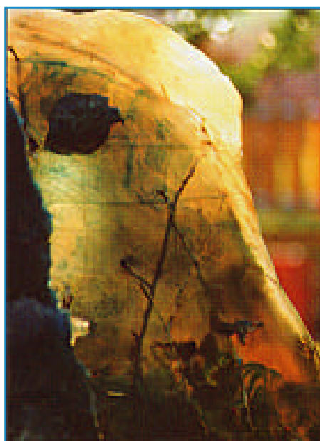
"Corso Dante, Corso d'Arte" di Alessandro Bondi