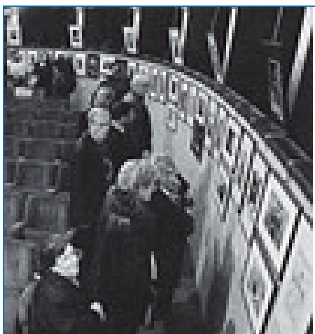
Collettiva fotografica