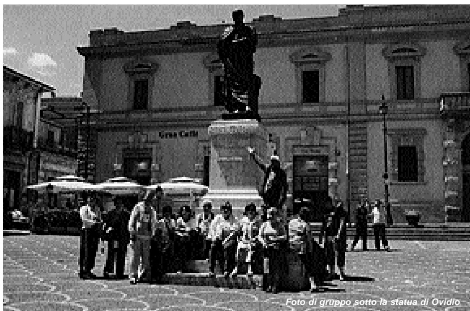
Foto di gruppo sotto la statua di Ovidio

nologia confettiera", annesso alla fabbrica, dichiarato Monumento Nazionale, conserva macchinari e impianti degli antichi sistemi produttivi. Altra particolarità è la lavorazione artistica dei confetti, legati con fili di seta colorati, per la preparazione di fiori, grappoli, spighe e cestini. Attraverso Porta Napoli si è poi entrati nella città. Lo splendido Acquedotto, opera di ingegneria idraulica, costituito da una lunga fila di archi, ha aperto lo sguardo sulla grande piazza del Mercato, affollata come sempre. La visita al Complesso dell'Annunziata, con annesso Museo, e del centro storico di Sulmona ha mostrato le bellezze di questa città che sta salvaguardando, con un attento restauro conservativo, il suo ricco patrimonio architettonico di epoca medioevale.