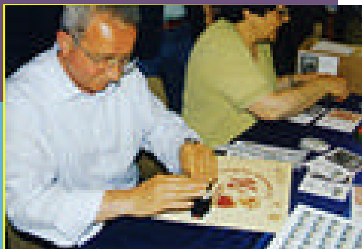
Funzionari delle Poste Italiane procedono all'annullo filatelico