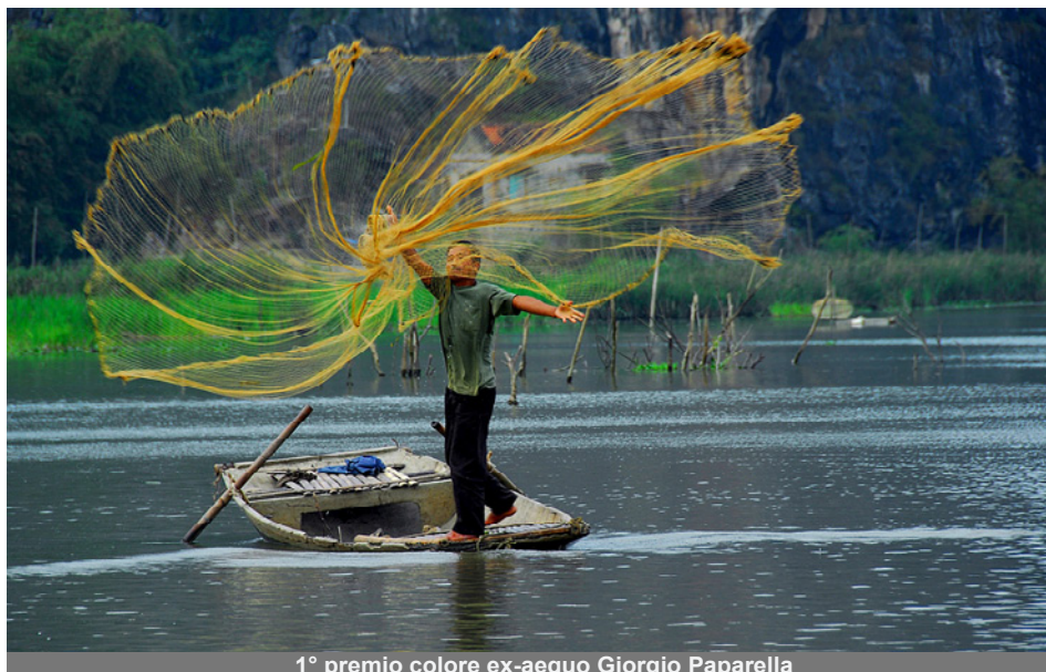
1° premio colore ex-aequo Giorgio Paparella