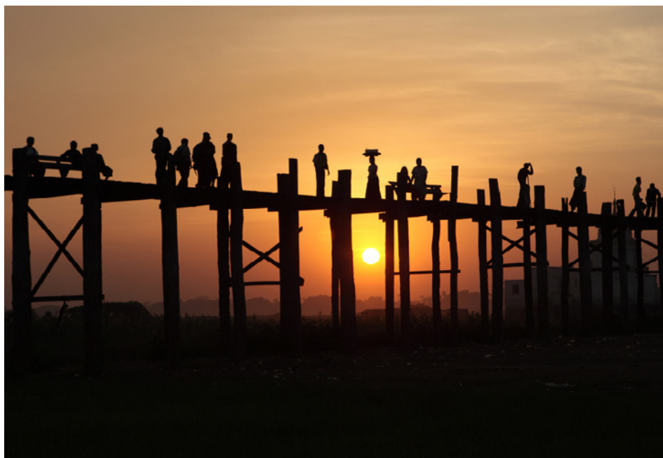
1° premio colore ex-aequo Enzo Barone