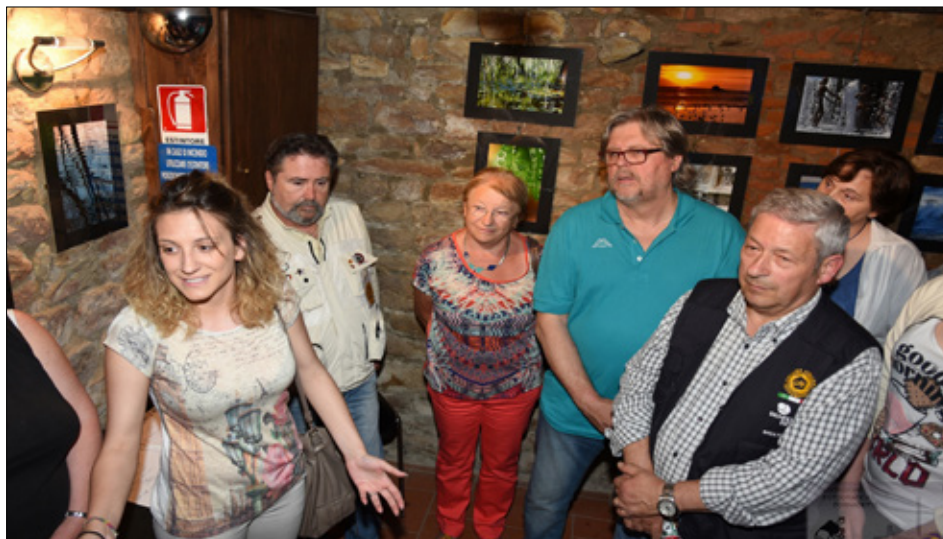
L'inaugurazione della mostra a Calcinaia

E cco che un colore in più è venuto ad aggiungersi alla mostra fotografica "Colore d'Europa". vale a dire la collettiva presentata dall'Associazione Fotografica Fornacette, in collaborazione con la Segreteria UIF di Pisa. Come ogni anno la collettiva viene esposta in un tour fotografico internazionale del Gemellaggio, un circuito, appunto, che partendo dal mio Capoluogo, Calcinaia, tocca le città con esso gemellate di Francia e di Spagna. Il nuovo colore è quello di Nordwalde, una cittadina tedesca della Sassonia gemellata con Amilly, in Francia, a sua volta gemellata con il mio Comune e che, grazie ad un suo foto club, è venuta ad arricchire con belle immagini questa ottava edizione della rassegna. "L'acqua in tutti i suoi aspetti", questo l'argomento trattato, prendendo spunto dal tema che l'AEA (Agenzia Europea Ambiente) aveva messo l'anno precedente al centro delle sue politiche per sollecitare l'uso corretto delle risorse disponibili e, soprattutto, di questo elemento naturale indispensabile per la sopravvivenza del genere umano. Ed ecco che l'acqua è stata immortalata in ogni aspetto e contesto possibili. Dalla purezza incontaminata della sua genesi, allo scendere variegato fino al mare tra cascate e pescosi laghetti; dal suo scorrere talvolta irruento e minaccioso a quello elegante e sornione sotto i ponti sui canali della Loira, ai rituali propiziatori sul fiume Gange, dal paesaggio bucolico all'inquinamento