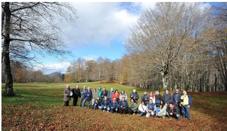
Il gruppo dei partecipanti al Congresso nell'area protetta di Fagnano Castello