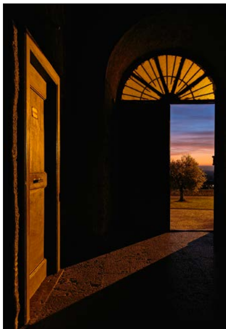
2° Premio Tema Libero Bartolomeo La Gioia