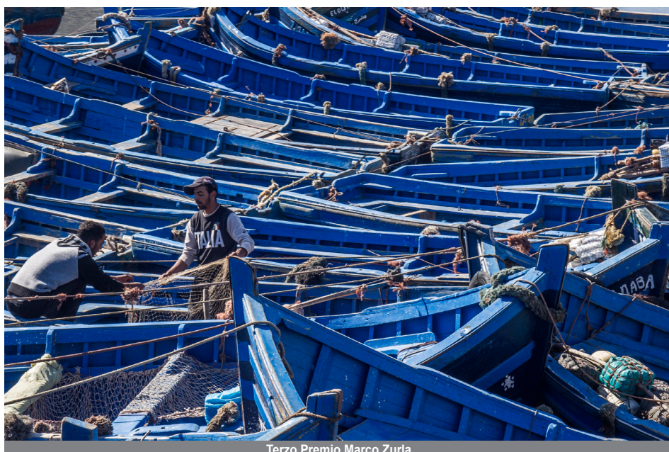
Terzo Premio Marco Zurla