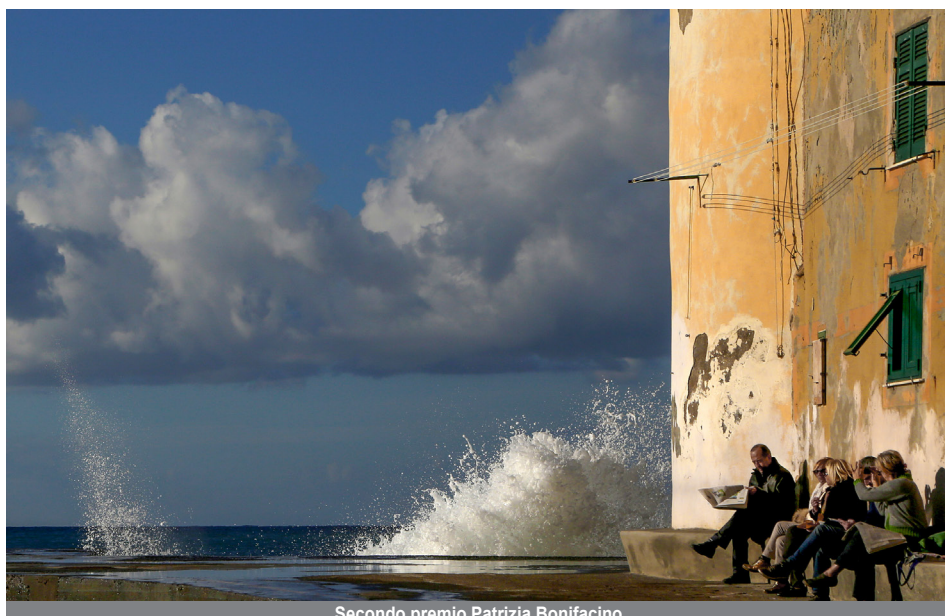
Secondo premio Patrizia Bonifacino