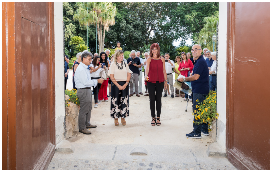
Il taglio del nastro augurale