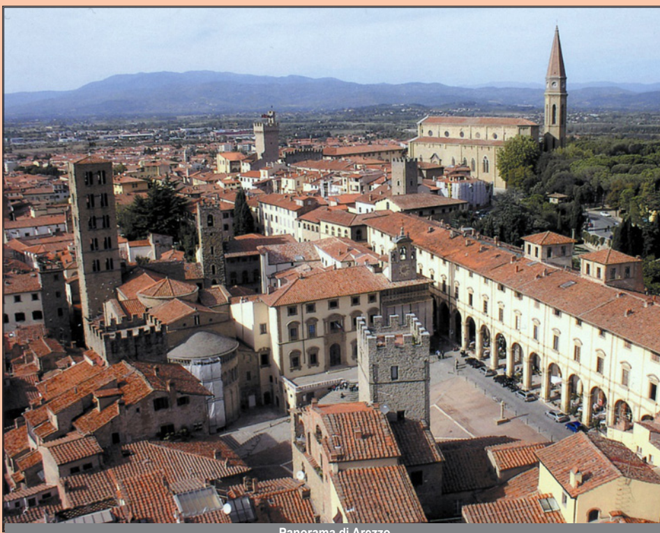
Panorama di Arezzo

Arezzo è un comune italiano di 99 487 abitanti, capoluogo dell'omonima provincia in Toscana. Conosciuta nel mondo come Città dell'oro, della Giostra del Saracino e di Guido Monaco inventore della notazione musicale, fu sede della più antica università della Toscana, e una delle prime in Europa. Arezzo fu una delle principali città etrusche insieme a Cortona, Chiusi e Orvieto all'interno della Valle del Clanis. A questo periodo risalgono opere d'arte di eccezionale valore, come la Chimera, conservata a Firenze, la cui immagine caratterizza talmente la città quasi da diventare un secondo simbolo e inoltre è da segnalare l'ampia necropoli di Poggio del Sole, formatasi nel VI secolo a.C. ed utilizzata fino all'età romana. Sotto la protezione del vescovo si sviluppò nel contado aretino anche un folto numero di abbazie, che contribuirono a ricostruire un sistema di scambi ed un minimo ambito culturale. In questo periodo Arezzo vide la nascita di un altro dei suoi figli illustri: Guido Monaco. Fattosi benedettino nell'abbazia di Pomposa e successivamente a Roma, elaborò il nuovo metodo di notazione musicale ed il tetragramma. Nel febbraio 1796, Arezzo fu sconvolta da uno sciame sismico di oltre trenta scosse di terremoto; il 15 febbraio i movimenti tellurici cessarono, a seguito del miracolo (secondo la tradizione cattolica) della Madonna del Conforto, un'immagine sacra oggi custodita nella Cattedrale di Arezzo.