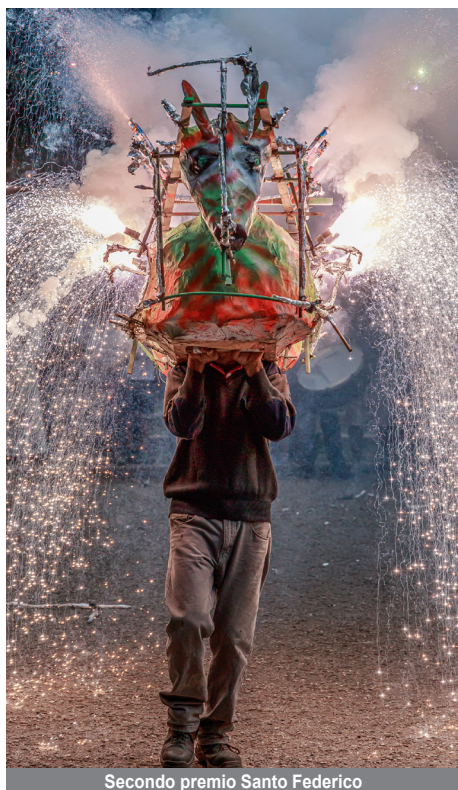
Secondo premio Santo Federico