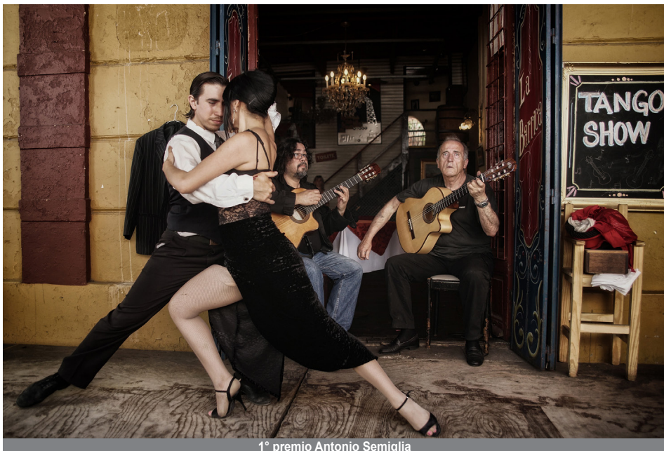
1° premio Antonio Semiglia

"Il pescatore di Ranise Adolfo" (quinta pari merito) - foto n. 529.