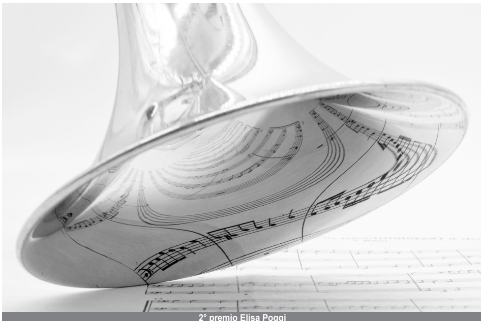
2° premio Elisa Poggi