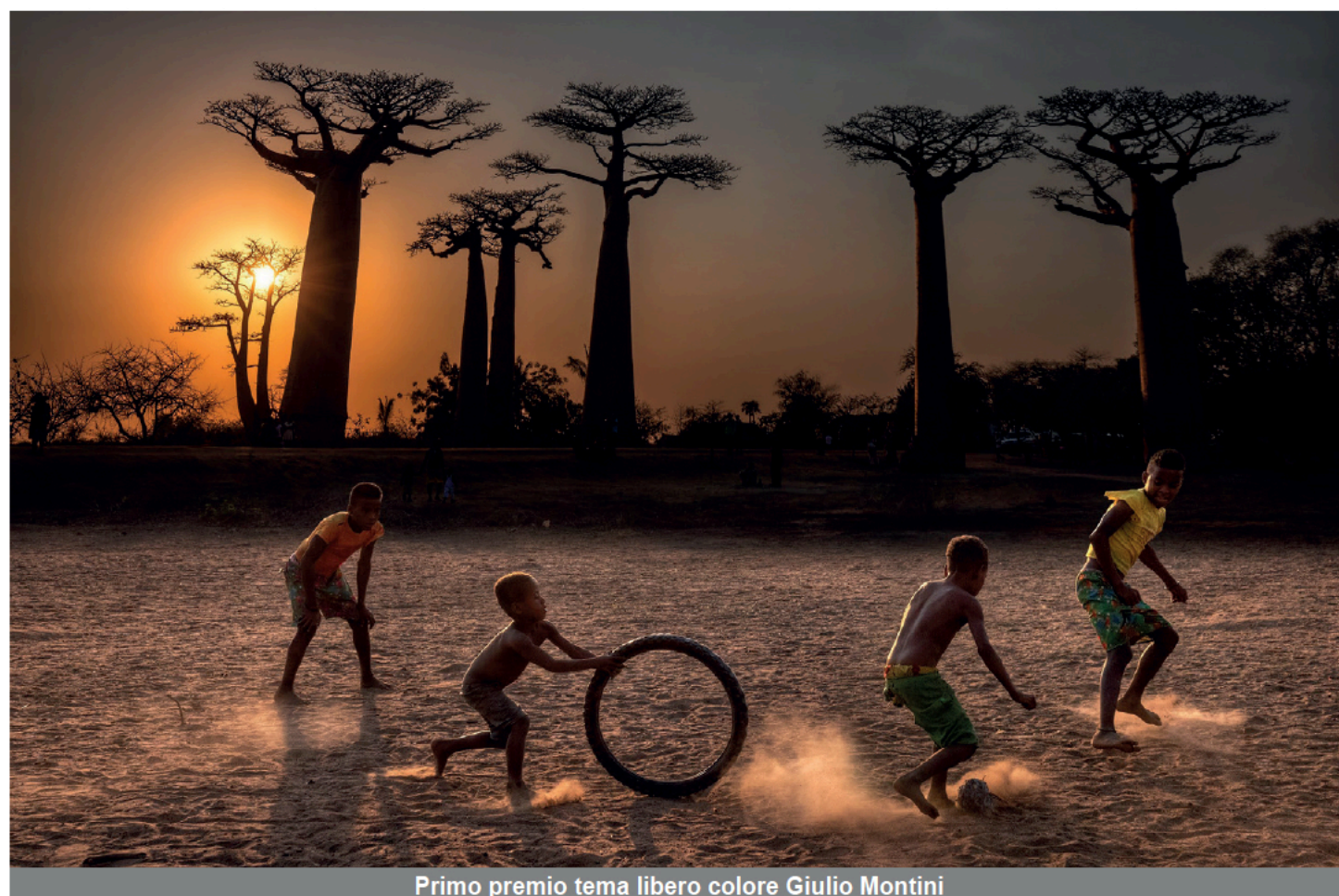
Primo premio tema libero colore Giulio Montini