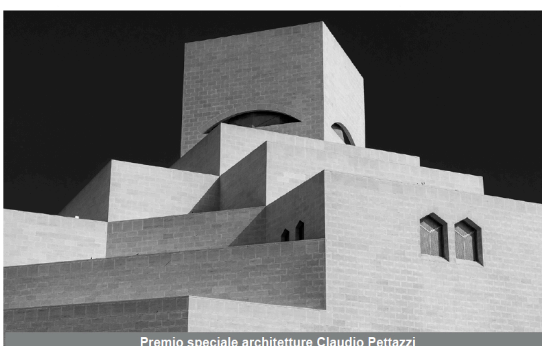
Premio speciale architetture Claudio Pettazzi