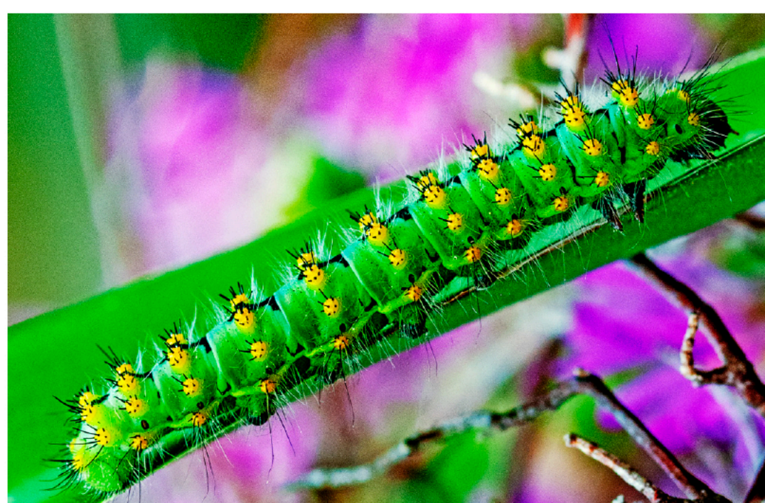
Premio speciale macro Ivano Santini