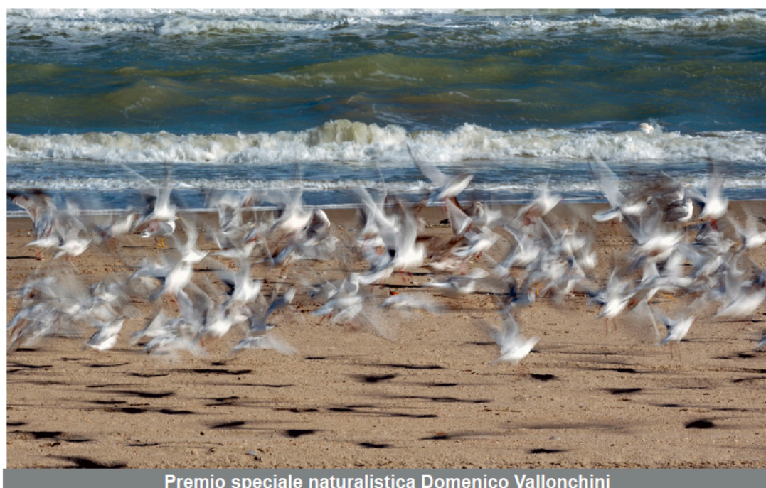
Premio speciale naturalistica Domenico Vallonchini